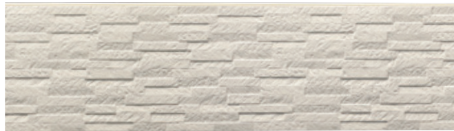
SF202 メイリーMGアイボリー