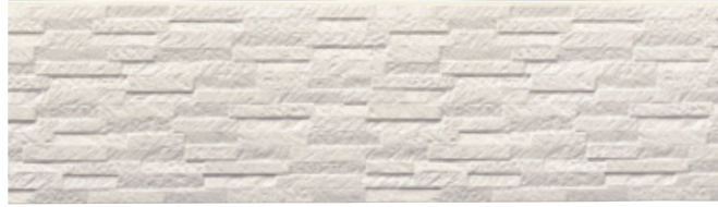
SF201 メイリーMGホワイト

ナチュラルテイストのすっきりとした色合いが、上品さを兼ね備えた佇まいを創造します。